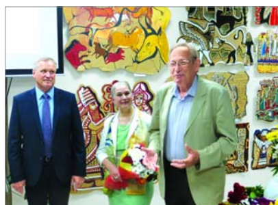
Юбилейная выставка детской художественной студии "Образ" в Протвинском Выставочном центре.